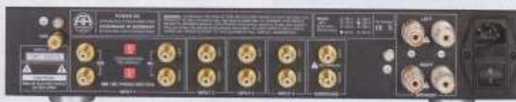
Über die roten DIP-Schalter zwischen den Phono-Eingängen werden MM- und MC-Typen vorgewählt. Das Anschlussfeld des POWER ES ist ebenso übersichtlich wie sein Innenleben, dessen hinteren Teil der Kühlkörper für die vier Endtransistoren samt Treibern einnimmt

über den sich gängige PC-Musik-Formate wie etwa WAV, FLAC oder MP3 wiedergeben lassen. Denn der Player ES ist von Accoustic Arts ebenso als hochwertiger CD-Spieler wie auch als D/A-Wandler für externe Quellen – wie etwa DVB-Empfänger – gedacht. Für diese und anderes in Sachen Chips, Netzteil und Ausgangsstufe weniger aufwändig gemachtes Digital-Equipment ist der SP/DIF-Eingang mit Cinch-Buchse vorgesehen. Die drei Wahl-tasten für die beiden Digital-Inputs – einen Digital-Ausgang sucht man leider vergeblich – sowie das interne Laufwerk sit-