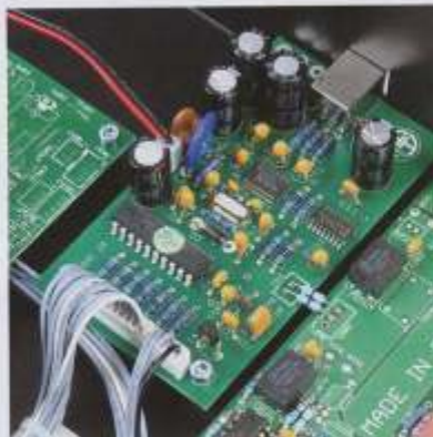
Aufwändig bestückt und auf dem neuesten Stand ist die Platine hinter dem USB-Eingang

Die mitgelieferten Fernbedienungen sind aus Kunststoff. Über die des Amps (l.) lässt sich nur die Lautstärke regeln