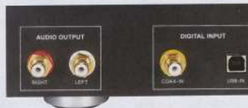
Das mit vier stabilen Spannungsversorgungen bestückte Netzteil-Board des Players zeigt den Aufwand. Sein Anschlussfeld ist puristisch besetzt (o.)