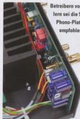
Betreibern von Plattenspielern sei die 500 Euro teure Phono-Platine wärmstens empfohlen

Hoher Aufwand auch beim USB-Eingang, der ein eigenes Board bekam und